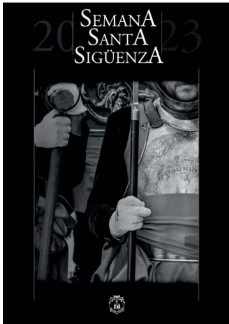
Cartel Semana Santa Sigüenza 2023