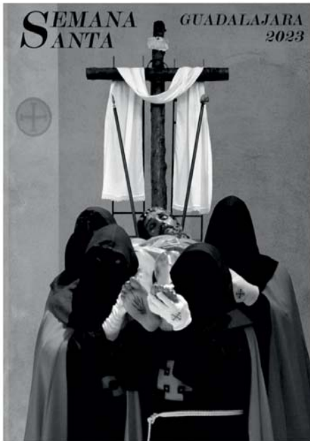
Cartel Semana Santa Guadalajara 2023